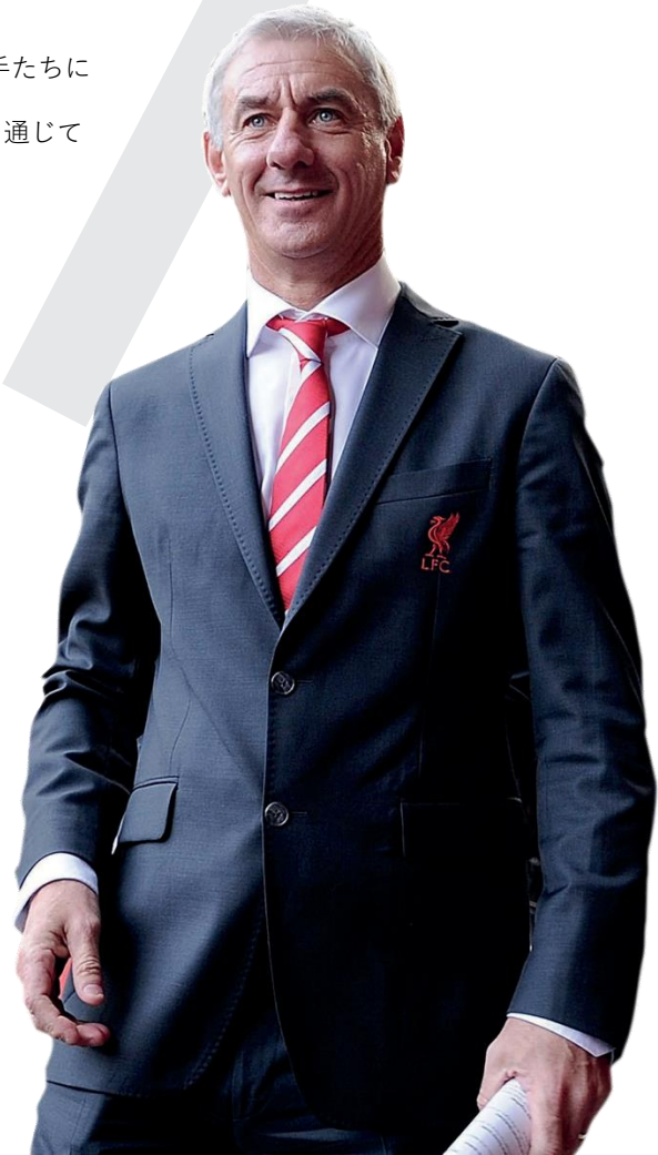
イアン・ラッシュ LFC International Academy Ambassador